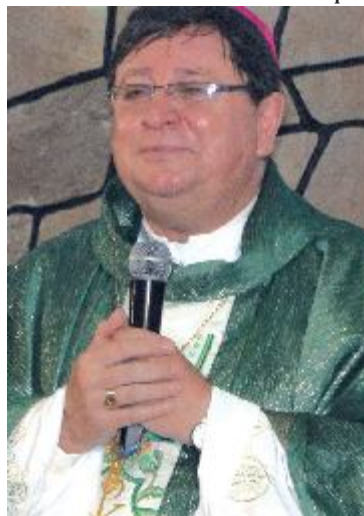
Dom João Bráz de Aviz