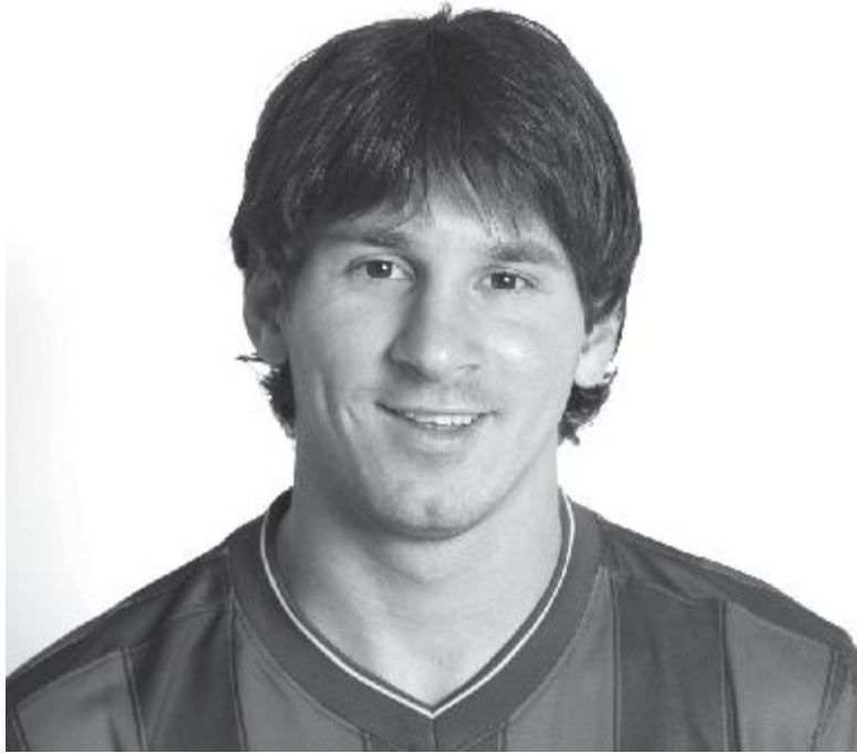
Lionel Messi: de autista e anão para campeão mundial