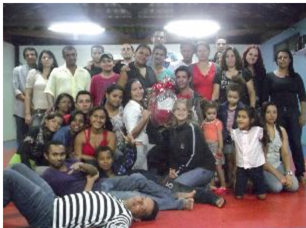
No dia 26 de novembro, na Academia do Xexéu (Setor Cristina), houve uma Celebração da Palavra e depois quermesse, bingo e muita diversão (sem bebida alcoólica). Foi uma promoção do grupo de jovens da Comunidade São Geraldo Magela.