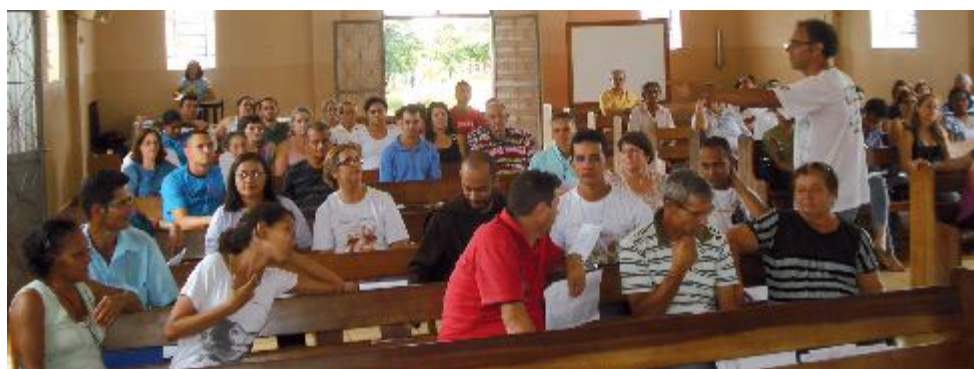
Avaliação e planejamento paroquial no dia 4 de dezembro no Parque Buriti

As Comunidades e pastorais, que ainda não fizeram o seu planejamento, têm todo o mês de janeiro para planejar. Para isto levem em conta os calendários da Arquidiocese, do Vicariato, da Paróquia e do Núcleo Pastoral.