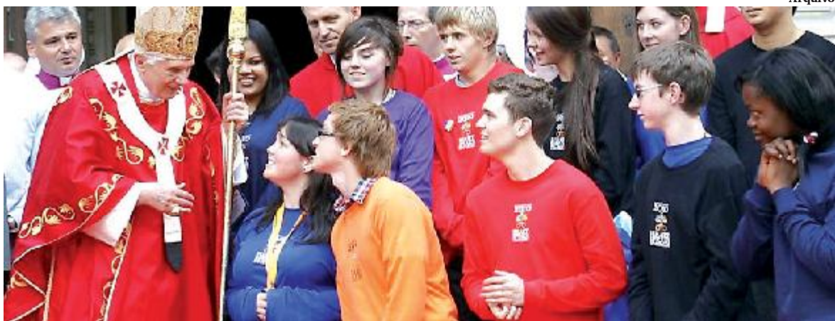
Bento XVI com Jovens da Jornada Mundial de Madri

da crise da Igreja na Europa é a crise da fé. Se não encontrarmos uma resposta para esta crise, ou seja, se a fé não ganhar de novo vitalidade, tornando-se uma convicção profunda e uma força real graças ao encontro com Jesus Cristo, permanecerão ineficazes todas as tentativas para reanimá-la. Neste sentido, afirmou o papa, o encontro com a jubilosa paixão pela fé, em sua viagem pela África, foi um grande encorajamento. “Lá não se sentia qualquer indício desta lassidão da fé, tão difusa entre nós, não havia nada deste tédio de ser cristão que se constata sempre no meio de nós. Apesar de todos os problemas, de todos os sofrimentos e penas que existem, sem dúvida, precisamente na África, sempre se palpava a alegria de ser cristão, de pertenc-